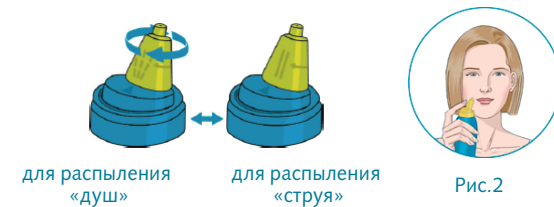
для распыления «душ» для распыления «струя»